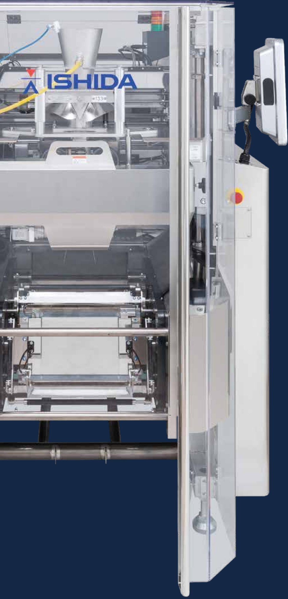
Maszyna pakująca do przekąsek