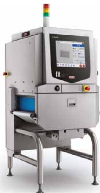
Габариты в мм