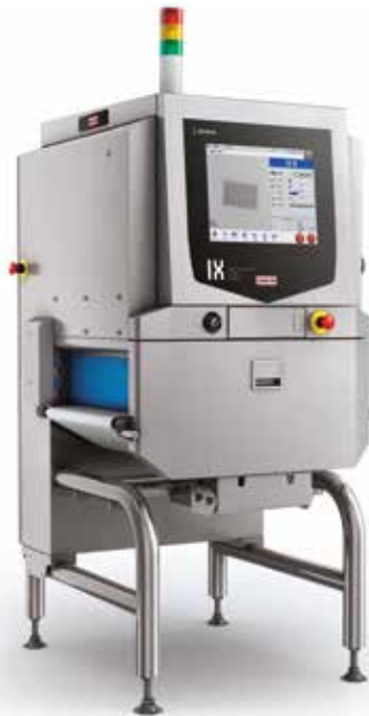
Габариты в мм