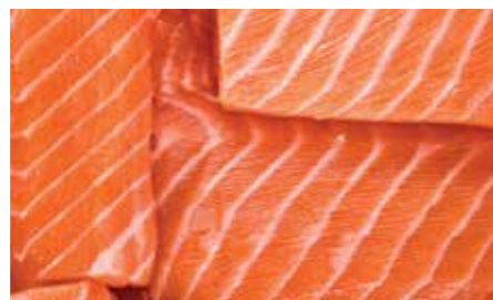
Fisch & Meeresfrüchte