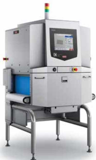
Габариты в мм

Благодаря инспекционной камере 550мм в ширину и 270мм в высоту, система IX-GN-5523 может эффективно находить посторонние включения, такие как металл, резину, костный остаток, твердый пластик и стекло, в упаковках весом до 25 кг.