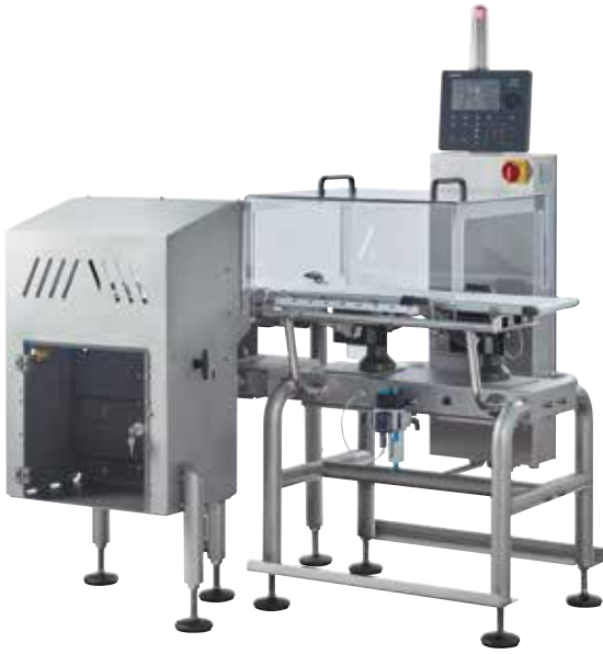
Exemple de système